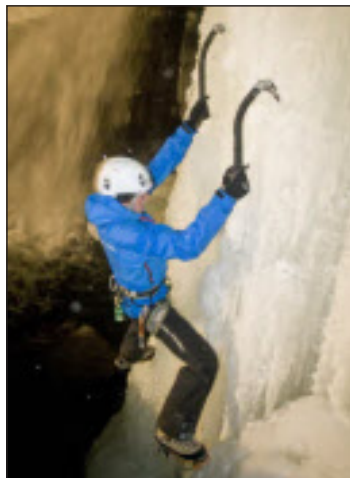
Abenteurer pur beim Eisklettern.

In Zukunft reicht nun das Angebot von Freeriden, Skitouren, Skihochtouren und Eisklettern im Winter bis Felsklettern, Trekkingtouren, Hochtouren und auch Mountainbike Transalptouren im Sommer.