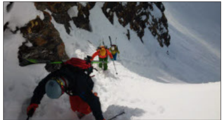
Mit den Ski geht's rauf auf den Gipfel, die Abfahrt lohnt die Mühen.